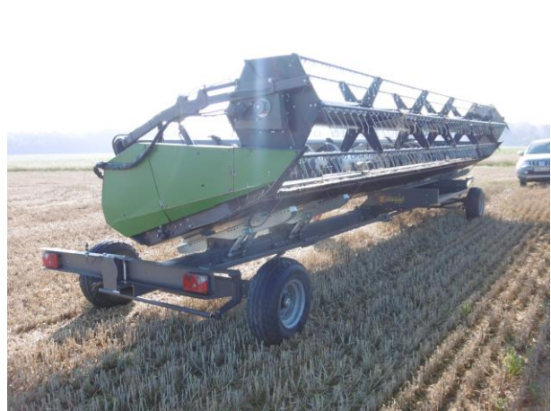
Schneidwerk mit Schneidwerkswagen