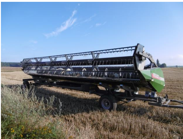
Schneidwerk mit Schneidwerkswagen