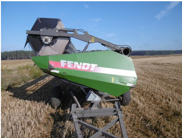
Verkleidung Schneidwerk verformt Gebrauchsspur